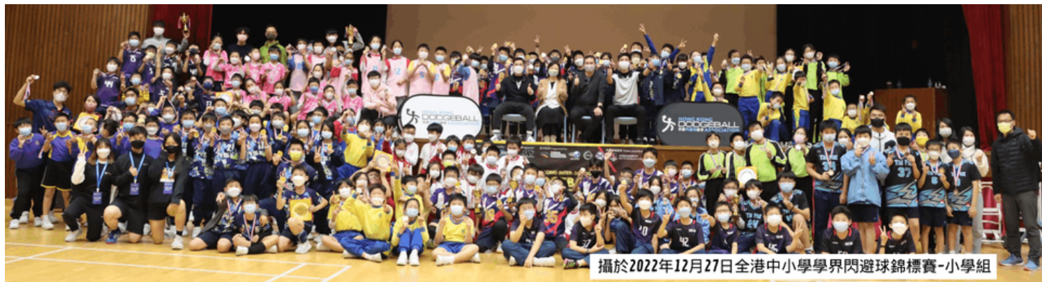
攝於2022年12月27日全港中小學學界閃避球錦標賽-小學組

參加2022年學界比賽之中學名稱 (排名不分先後)：漢基國際學校、沙田官立中學、沙田循道衛理中學、香港教師會李興貴中學、循道中學、仁濟醫院林百欣中學、佛教葉紀南紀念中學、香港中文大學校友會聯會陳震夏中學、香港教育工作者聯會黃楚標中學、九街坊婦女會孫方中書院、順德聯誼總會鄭裕彤中學、獅子會中學、筲箕灣東官立中學、聖公會聖本德中學、瑪利諾神父教會學校、廠商會中學、嶺南中學、靈糧堂怡文中學